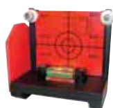
Cible universelle pour tuyau de 200/250/300mm